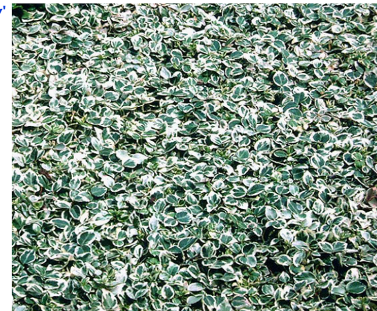
K2. trzmielina 'Emerald Gaiety'