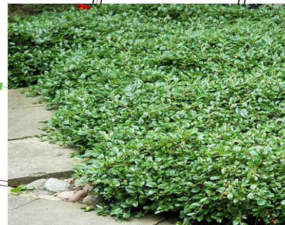
K1. irga 'Major'